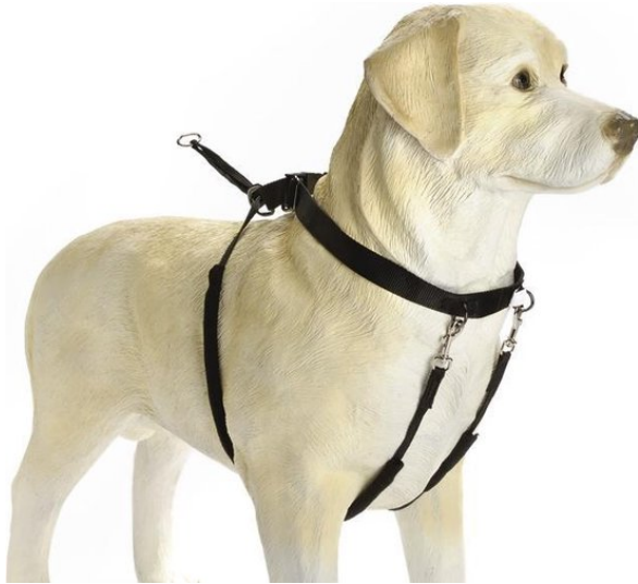
recht naar achteren trekken beoordelen met lichte spanning